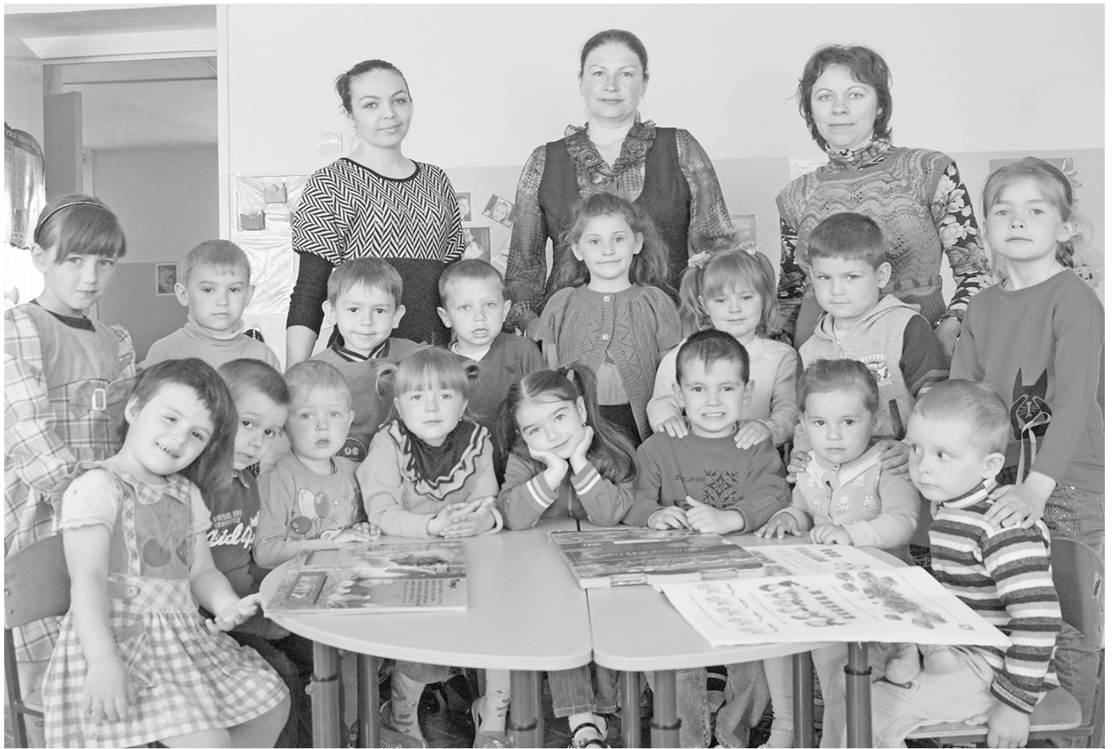
«Василёк», группа в с.Паликский кирпичный завод.

Обучающие занятия проводятся в основном в игровой форме с регулярности согласно расписанию. И во время развлекательных игр тоже используется любая возможность чему-нибудь научить