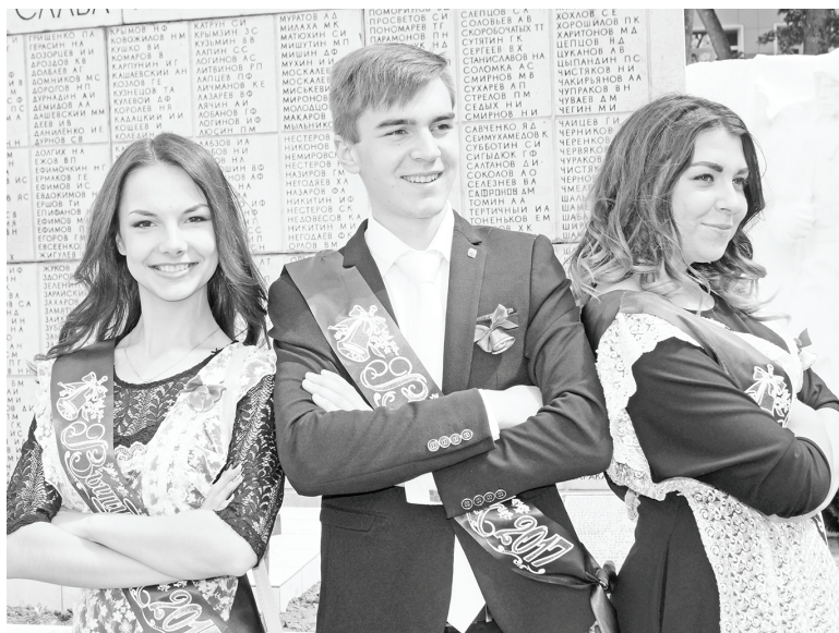
Выпускники-2017: нас ждут великие дела.