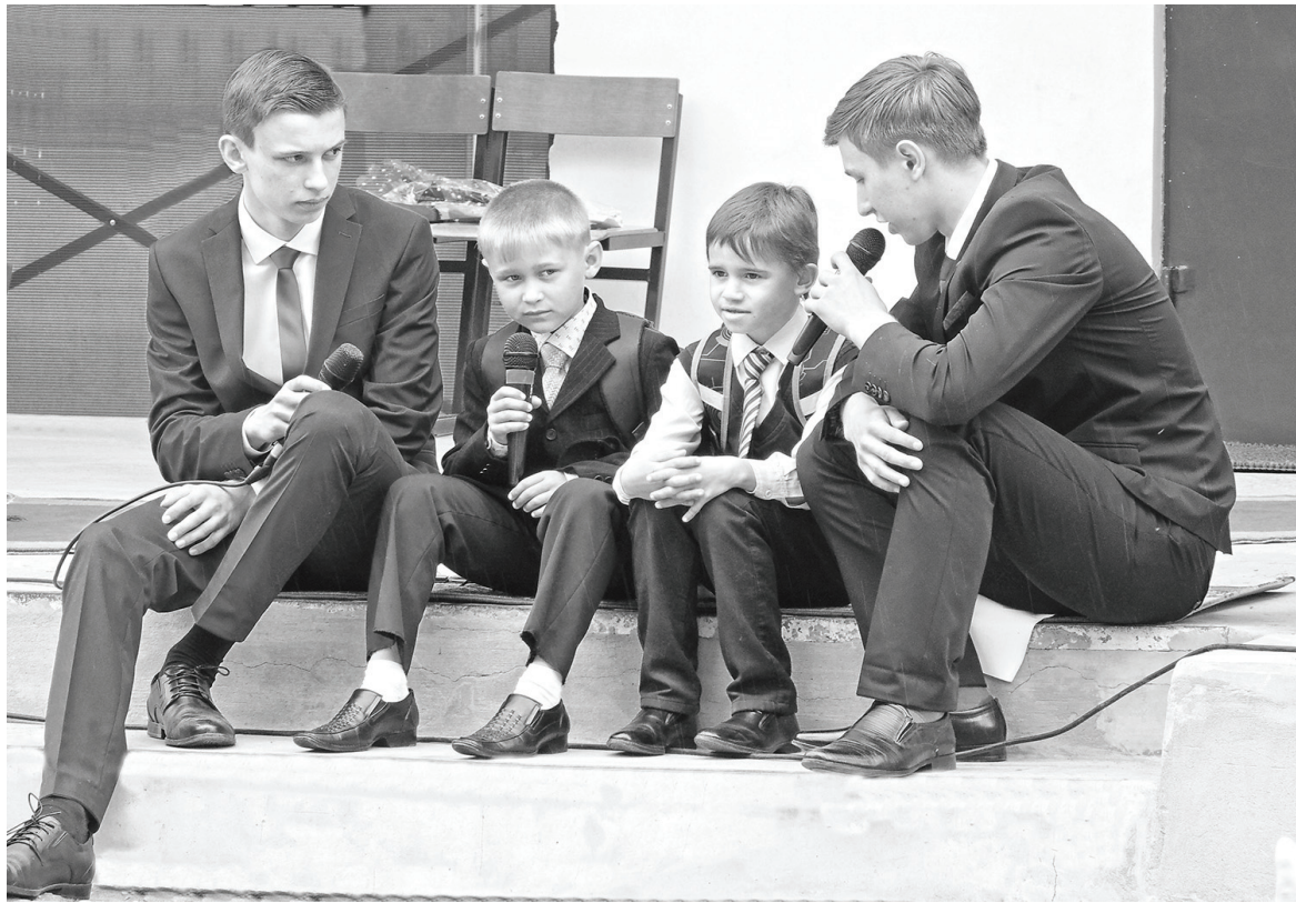
Вертненская школа: эстафета поколений.