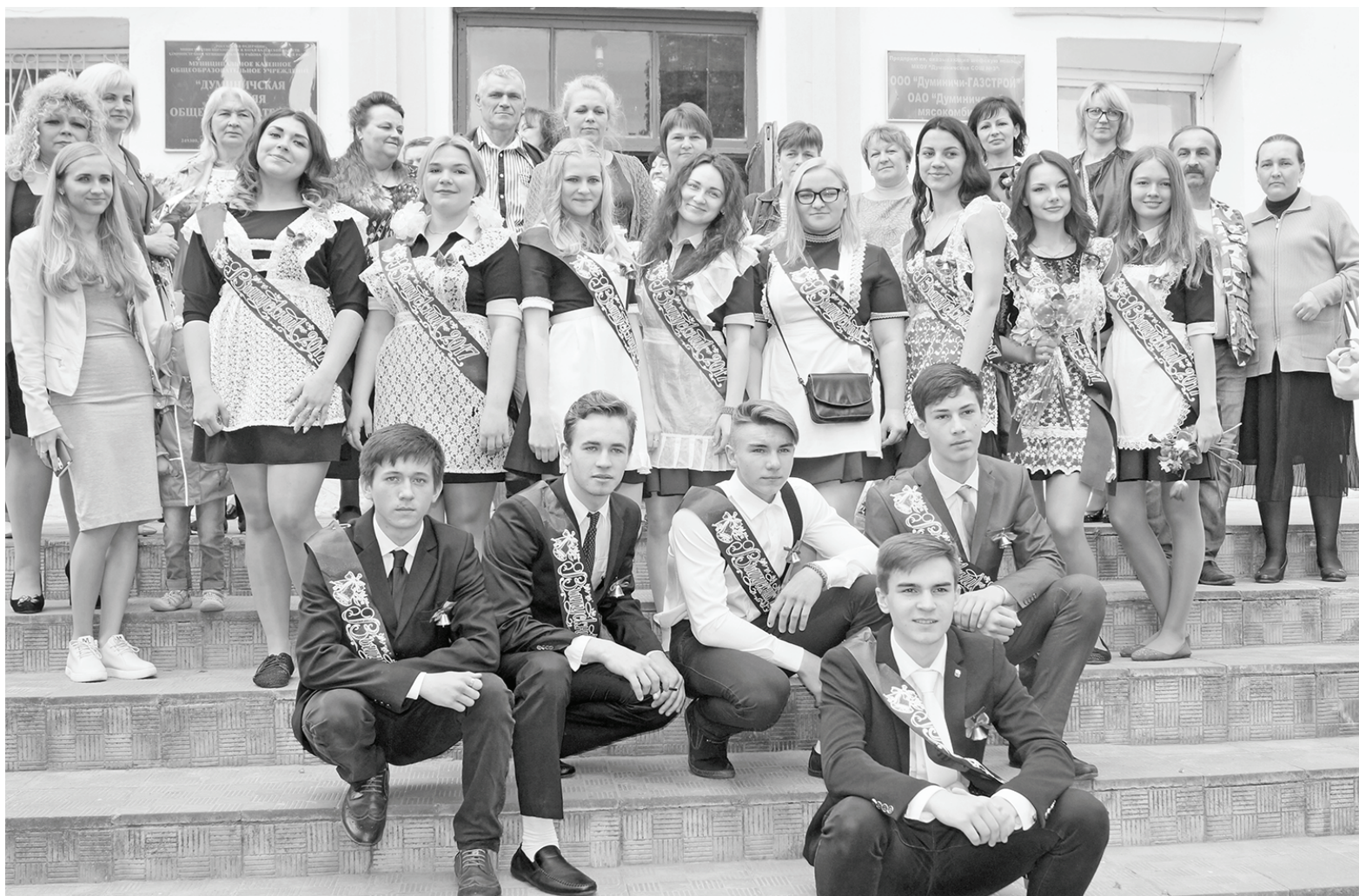
ДСШ №3: фото на память.

всё прошло, как говорится, без сучка и без задоринки.